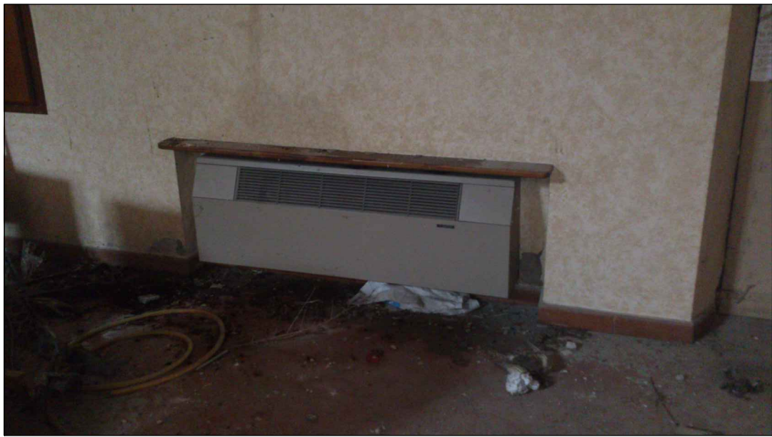
STATO DI FATTO IMPIANTO DI RISCALDAMENTO CAPPELLA CON VENTILCONVETTORI

VE VENTILCONVETTORE PENSILE A PARETE PORTATA D'ARIA MEDIA VELOCITA': 980 mc/h POTENZA ELETTRICA ASSORBITA: 106 W TIPO: AERMEC MOD. FCX84U O SIMILARE